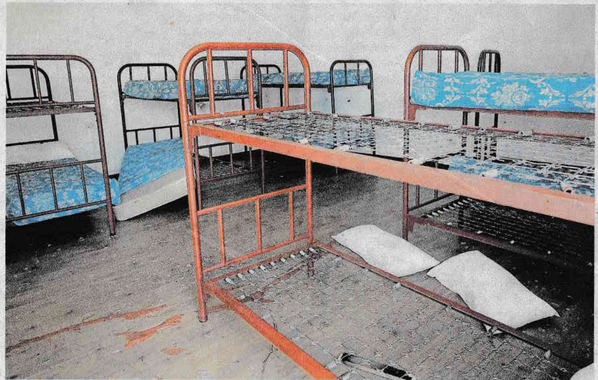
La escuela unitaria Tomás Serantes muestra un estado de deterioro debido al abandono y a los actos vandálicos

de este edificio se ha ido deteriorando con el tiempo por lo que la cesión a las entidades pasa por una rehabilitación del edificio, que les permita recibirlo en condiciones aceptables.