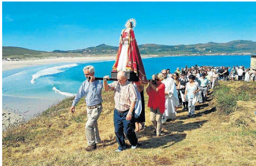
La virgen sale en procesión tras ocho años seguida de los visitantes que se acercaron a la isla en peregrinación | LAURA PAZO

[PÁG. 17] La ermita de Santa Comba se convirtió ayer en un lugar de peregrinaje debido a la recuperación, después de ocho años, de la romería a la capilla. Tanto vecinos como gente de paso subieron por primera vez las nuevas escaleras y celebraban su construcción, aunque algunos ironizaban con la necesidad de construir un puente a la isla para no tener que mojarse los pies en la arena.