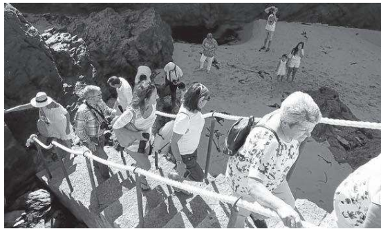
Grandes y pequeños no quisieron faltar a esta tradición, ahora rescatada bajo la organización de la asociación Columba, por lo que aprovecharon para inmortalizar el momento. En paralelo, las carrozas llenaron de ambiente festivo la parroquia. | L.P. / A.EIRIZ