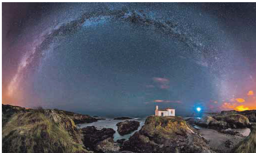
Vía láctea. Para tomar esta imagen de la Vía Láctea sobre la ermita del Porto, en Meirás, los fotógrafos contaron con la colaboración de la piscifactoría situada en esa zona de la costa, que apagó todos sus focos. La imagen ofrece una visión de 200° y para obtenerla se montaron un total de doce fotos.

Captar todas estas imágenes no fue tarea sencilla, porque, según apunta Lois, en este tipo de fotografía se tienen que dar una serie de circunstancias, como que el cielo esté despejado (una cuestión muy complicada en Galicia) y que no haya cerca ningún foco de contaminación lumínica. Quienes quieran hacerse con el libro no tienen más que contactar con la editorial en info@ludica7.com .