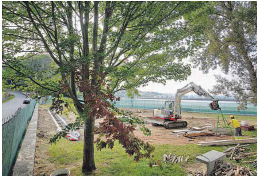
Trabajos de la nueva instalación de saneamiento en la zona del parque de A Cabana. JOSÉ PARDO

La UTE formada por las empresas Construcciones Ramón Vázquez y Reino, Construcciones Cernadas y José Mantiñán e Hijos, a la que la Consellería de Infraestructuras e Mobilidade adjudicó las obras de saneamiento de la ensenada de A Malata por algo más de 5,4 millones de euros, inició los trabajos a principios del pasado mes de abril. Según se informa desde la Xunta, las obras avanzan y, tras haber instalado ya un primer tramo del colector, hubo que cambiar temporalmente de zona de actuación, porque las intervenciones previstas en el puerto es-