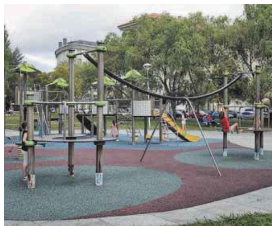
La actuación en el parque Pablo Iglesias sirvió para reponer la tirolina.

la concejalía acaba de asumir el mantenimiento de los parques de ocho colegios de la ciudad, tras expirar el contrato encargado a través de la concejalía de Educación: Cruceiro de Canido, Esteiro, Manuel Masdías, Pazos, Ponzos, Recimil, San Xoán de Filgueira y Juan de Lángara. El gobierno local hace un llamamiento al correcto uso de sus elementos y que se alerte de los daños en el 981 944 000, en el propio Ayuntamiento o a través del correo atencionciudad@ferrol.es.