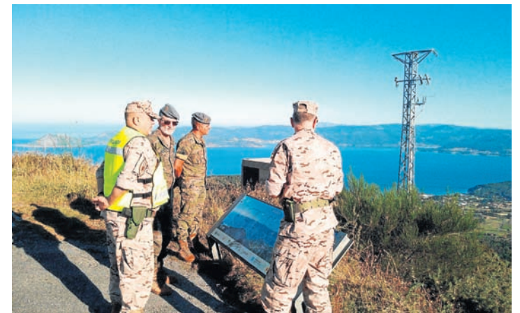
Visita del general Romero, jefe de la operación, a las patrullas del Tercio

Las personas interesadas en conocer el desarrollo de estas actividades pueden contactar con la asociación sociocultural ASCM en el teléfono 981 351 430, el correo comunicacionascm@gmail.com o de forma presencial en su sede de las calle San Roque y Ánimas. El horario es el habitual de invierno, de 9.30 a 13.30 y de 16.00 a 20.00 horas. ●