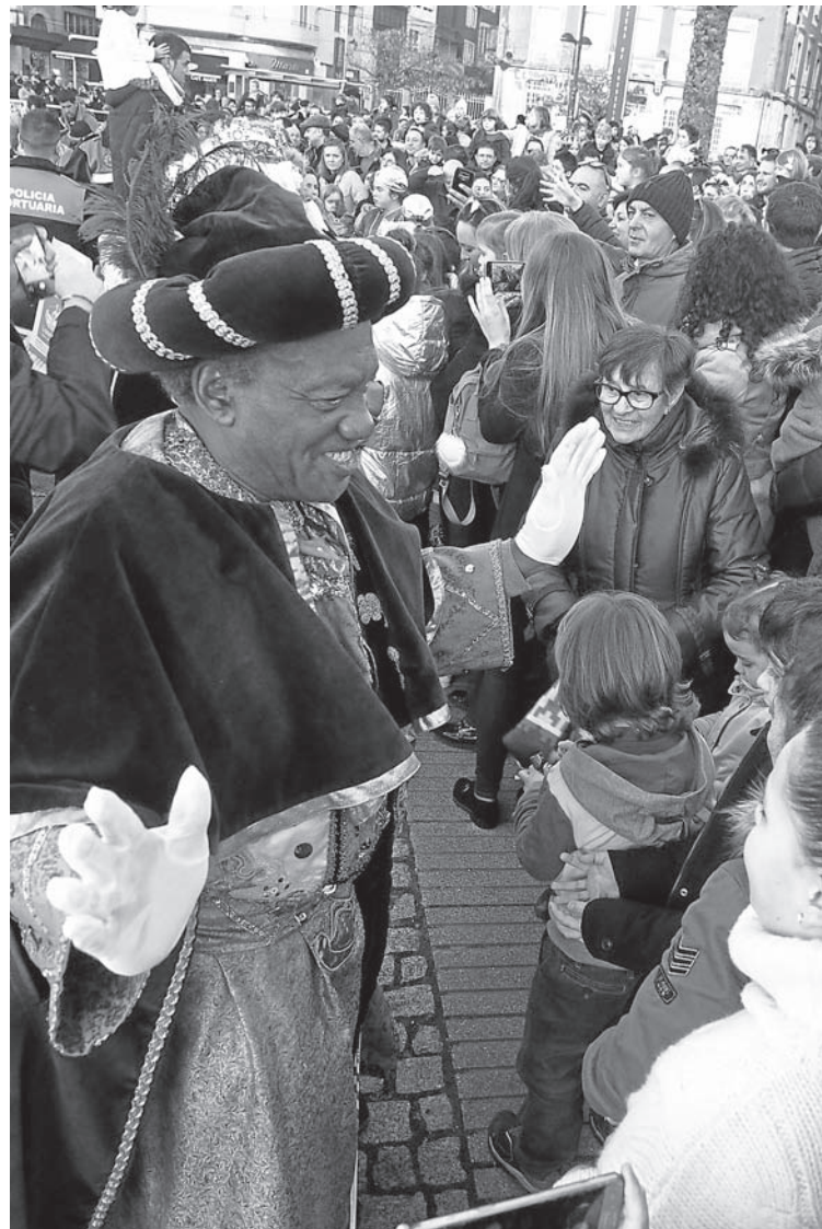
Un momento de la Cabalgata de Reyes del año pasado