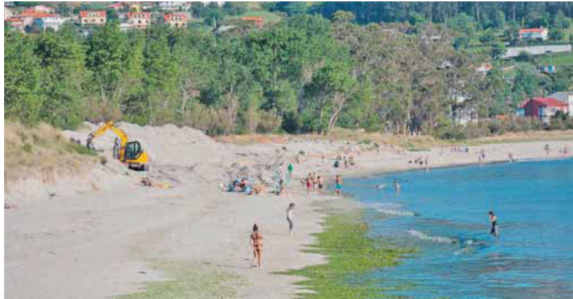
Los bañistas han convivido con las máquinas en A Magdalena desde principios de mes.

La Cofradía de Pescadores Nuestra Señora del Carmen busca porteadores para las fiestas del mes de julio. Pide a todos los interesados en colaborar que se acerquen al pósito carriñés lo antes posible. LA VOZ