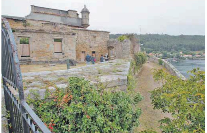
Imagen de las construcciones más antiguas de la fortaleza, las que van a ser rehabilitadas.