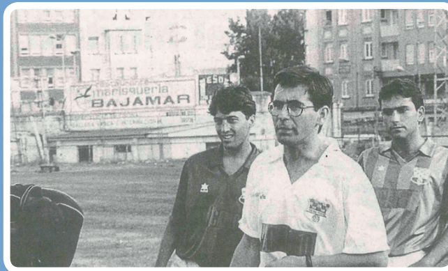
La victoria supuso un auténtico alivio para la situación de Fernando Vázquez

El Somozas mantiene la intención de dar caza al Betanzos en la cabeza de Preferente y lo demostró con un triunfo por 2-1 sobre el San Lázaro en un campo completamente encharcado.