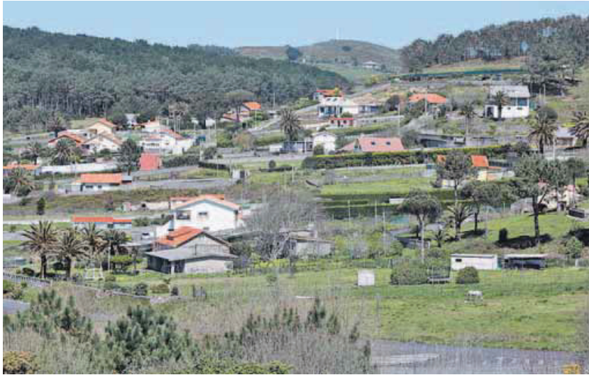
El lugar de Tralouteiro, enfrente al arenal de Doniños, es la zona con más informes.

El lugar de Tralouteiro (San Xurxo), enfrente a la playa de Doniños, es la zona que más expedientes acumula de reposición de la legalidad urbanística. En la actualidad se está comprobando la total demolición de una caseta prefabricada; está prevista la ejecución subsidiaria de una vi-