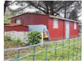
Un ejemplo de los expedientes.

Al borde de la carretera que transcurre entre las playas de Doniños y San Xurxo se encuentra una de las viviendas con orden de demolición. Al principio fue una chabola, luego se convirtió en una caseta metálica y, por último, quedó la actual construcción de cemento. La propietaria falleció y ahora pertenece a una familia cercana que, de hecho, acudió hace poco a desbrozar la finca. El expediente lo solicitó la comunidad de montes por ser la parcela de su propiedad.