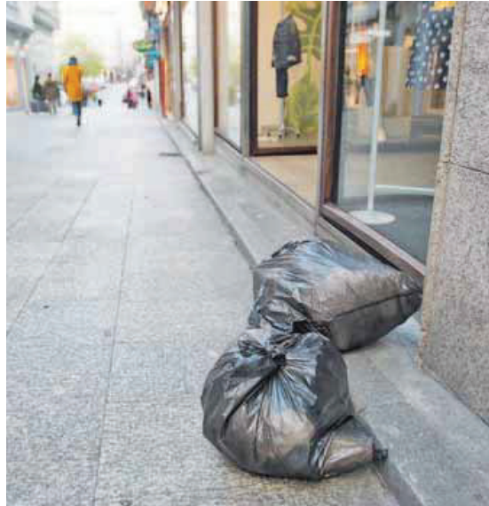
La basura, en la puerta de casa. Hay residentes de las calles del centro que siguen dejando las bolsas al lado de sus portales en lugar de llevarlas al contenedor. Una costumbre que se debió cambiar hace décadas, pero que en Ferrol continúa obligando a detenerse cada pocos metros a los camiones de recogida. JOSÉ PARDO

La empresa Ecoembes desarrollará hasta julio un reto. La iniciativa busca mejorar las cifras de reciclado del contenedor amarillo, en el que se depositan plásticos, bricks y latas, proponiendo el reto de elevarlas un 10 % con respecto al mismo período del año pasado. Los concellos no compiten entre sí, sino consigo mismos. Si este reto se consigue, el esfuerzo será premiado con fondos en metálico, que cada concello donará a la entidad que elija. En la web www.une-teareto.com se irán publicando un marcador con los resultados.