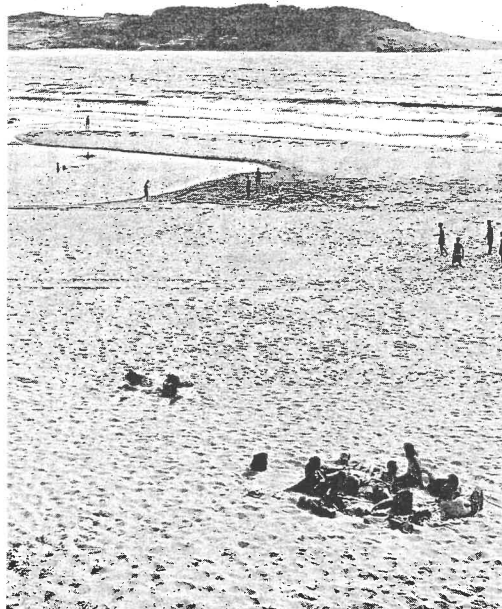
En la imagen de archivo, la playa de Esmelle, que se mejorará

En todas esas playas se instalará, según la respuesta parlamentaria, un torreta de salvamento de madera, así como urinarios, duchas, vestuarios y aparcabicicletas. Se completará la instalación con paneles informativos sobre