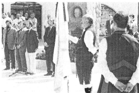
Acto celebrado en Ferrol, en 1999, ante o monumento a Fontenla

Afirma o concelleiro ferrolán que «sen Fontenla, sen a súa entrega xenerosa e desinteresada, sen a súa devoción por Galicia, hoxe non teríamos nin Academia nin Himno». E asume o compromiso de que o Concello, coincidindo precisamente co centenario do nacemento da institución que hoxe