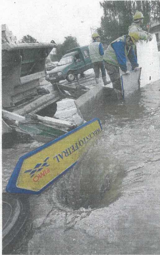
Dos operarios tratan de desviar el agua hacia un sumidero

RIADA La avería provocó una inundación en la zona de O Raposeiro y problemas de tráfico