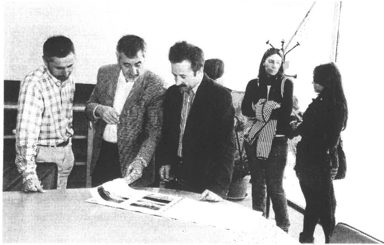
Responsables de la entidad Columba consultando el documento del plan director para la zona de Covas J. MEIS

Mina de oro y baterías > También hizo hincapié en elementos como la mina de oro de Covardeiras, el lavadero de mineral existente y las baterías de Cabo