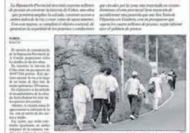
Imagen de la noticia publicada en La Voz.