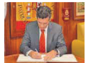
Firma del embajador español.

Durante su visita al patrullero de altura, como suele ser tradicional, el embajador de España en Senegal estampó su firma en el libro de honor del buque, en presencia del comandante.