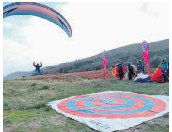
Los pilotos debían aterrizar en una diana a 1,5 kilómetros de la salida.