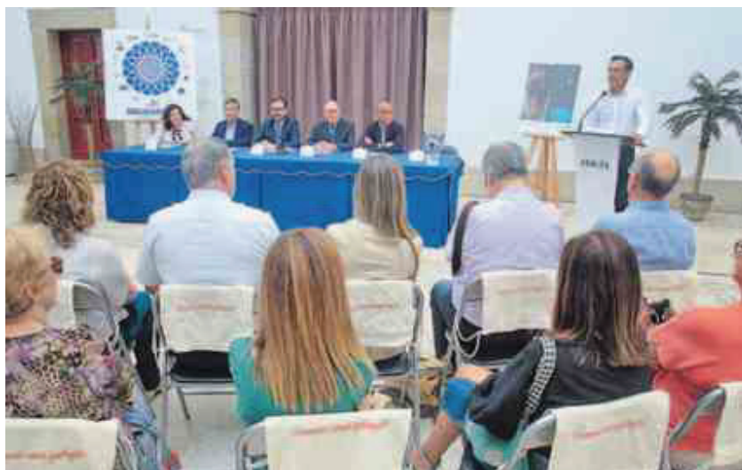
Acto de presentación del programa de Equiocio 2019 en el centro Torrente Ballester.

«La equitación es solo una de las patas de este evento; es cierto que si la cortáramos probablemente se nos caería, pero Equiocio es mucho más», destacó Pérez Lago, que vuelve a apostar en esta edición por un trabajo sos-