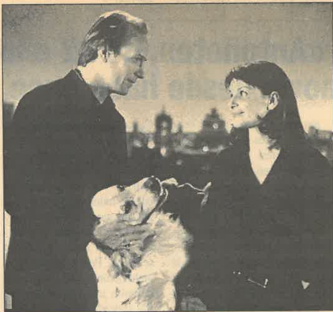
«Romance en Nueva York», el amor de un psicólogo y una bailarina

A priori tiene como rival a la superproducción norteamericana Un pueblo llamado Dante's Peak , en la que una vez más Hollywood demuestra su abso-