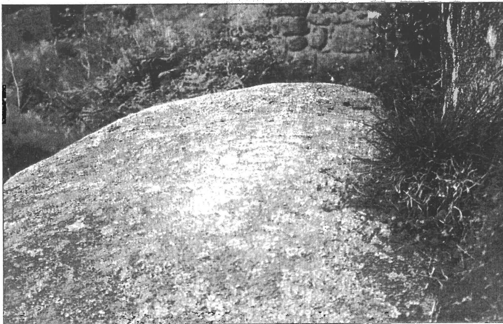
Nas inmediacións da ermida de Chamorro áchase unha pedra de grandes dimensións na que se pode ver un petroglifo