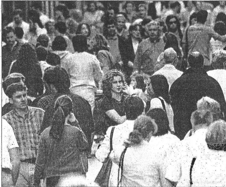
Los investigadores tratarán de probar que la decadencia, como valor de los ferrolanos, deja paso a la esperanza

«Nuestro estudio», apunta Fernández de Rota, «trata de ser riguroso y esto pasa por valorar todos los aspectos que forman parte de la cultura local». De ahí, dice, que haya que introducirse en las culturas empresariales, especialmente Astano y Bazán, en los barrios