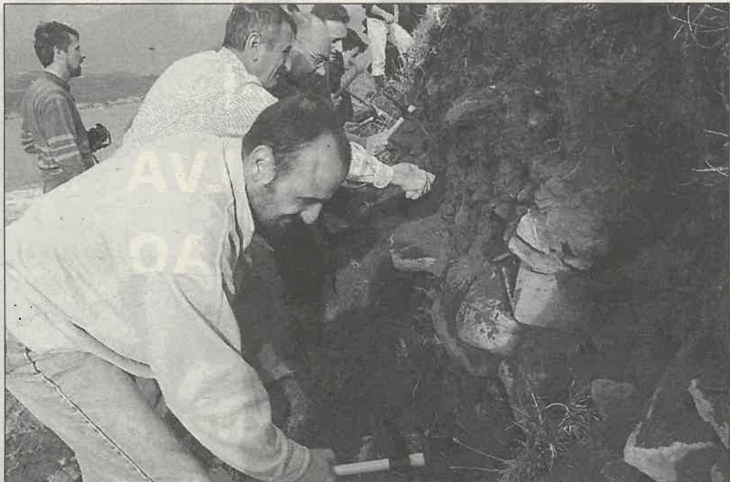
Las excavaciones confirmaron la existencia de asentamientos prerromanos en lo alto de la isla