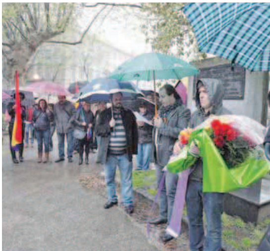
La lluvia dificultó la ofrenda floral de EU en el Cantón. CÉSAR TOIMIL

El PSOE de Ferrol también leyó un manifiesto sobre las mujeres y la representación política, aspecto en el que centraron los actos de la república de