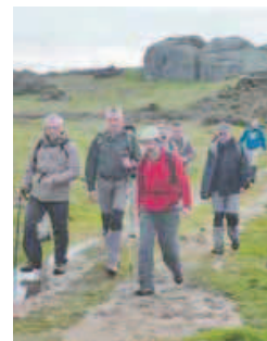
La lluvia respetó esta salida del club ferrolano.

cortes que se están produciendo, algo contra lo que también protestarán con una pancarta que pretenden colgar de la fachada. Por último, invitan a los vecinos a sumarse a la protesta.