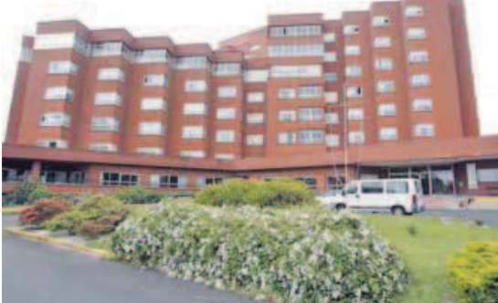
La residencia de Caranza cumple 36 años. CÉSAR TOIMIL

Por ello, montarán una oficina al aire libre, en los accesos a la residencia y realizarán una concentración en la entrada principal. Con estas medidas de presión pretenden reclamar