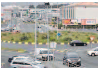
Glorieta en Nicasio Pérez. Una de las principales del polígono de A Gándara.

LOS CUATRO PUNTOS NEGROS DE LA SINIESTRALIDAD EN FERROL. Son aquellos en los que la Policía Local ha detectado al menos cinco accidentes en un radio de 50 metros en torno al punto del siniestro; la mayor parte coinciden con glorietas. El existente en el entorno de la plaza de Galicia se erradicó tras la reparación de los peores baches.