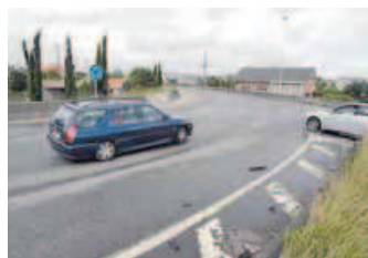
Rotonda de Basanta. Punto de encuentro de la AP-9 y la FE-15.