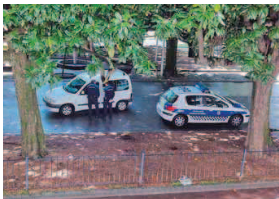
Agentes locales multando ayer a un conductor mal estacionado. R.P.P.

Por el momento, lo único que queda a salvo de las posibles multas es la zona azul, que, por el momento, señaló el concejal,