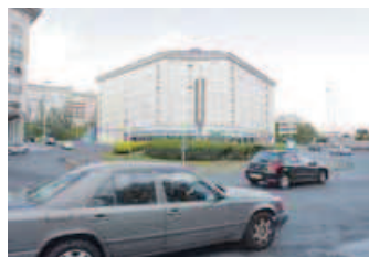
El Diapasón. El nudo de comunicación entre Caranza, Esteiro y la Trinchera.