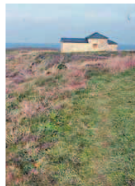
Capilla de Santa Comba