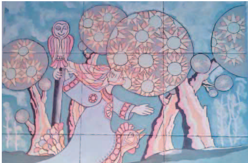
El Mago Merlín, cabalgando un gallo a través de la selva de Esmelle.