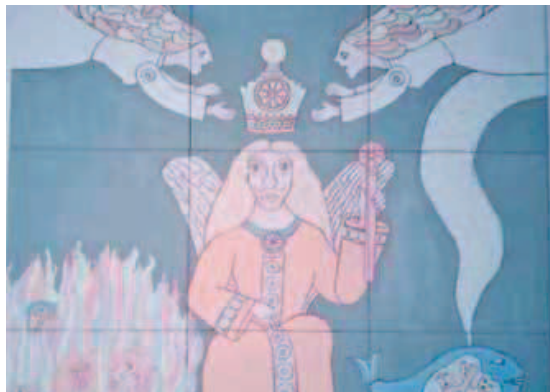
Coronación de León de Bretaña, el monarca alado. F. PÉREZ PORTO