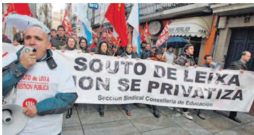
Imagen de archivo de una de las protestas desarrolladas por el centro contra su privatización.