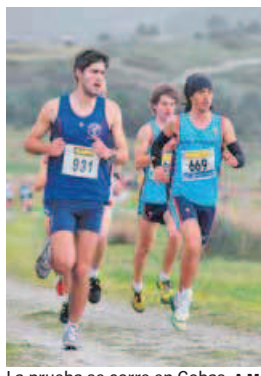
La prueba se corre en Cobas.