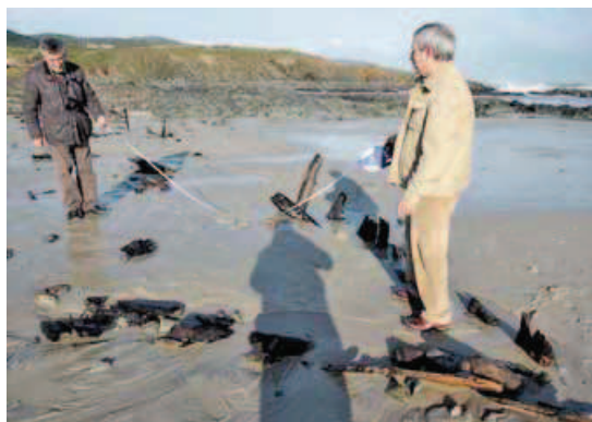
Miembros de Columba examinando los restos hallados.

No obstante, la aparición de este pecio ha desatado la curiosidad de expertos y aficionados. Facebook mantiene vivo un activo debate en el que se exponen diferentes opiniones, como la de que la embarcación dataría de un período postmedieval. El caso ha llegado, a través de uno de los usuarios del grupo Naufragios, al Museo de barcos vikingos de Oslo, que ha respon-