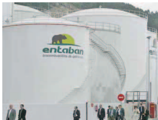
Entabán inauguró su planta en junio del 2008.

La puesta en valor de las concesiones rescatadas y el impulso a las líneas de negocio exitosas y en marcha son la mejor receta para borrar esos lunares de Caneliñas, llamado a ser el gran eje del tráfico portuario gallego.