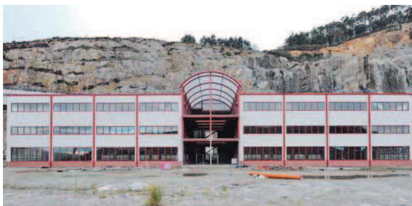
Vista del edificio de la Cámara de Comercio ubicado en el puerto exterior.

Fuentes oficiales consultadas en la Autoridad Portuaria Ferrol-San Cibrao han confirmado que el inmueble pertenece todavía a la Cámara, a pesar de la delicada situación del ente. Comenzó a construirse con el objetivo de convertirse en un vivero de compañías relacionadas con la actividad marítima pero sin capacidad, por sí mismas, para lograr una concesión en suelo portuario. Pero la obra se paralizó en verano