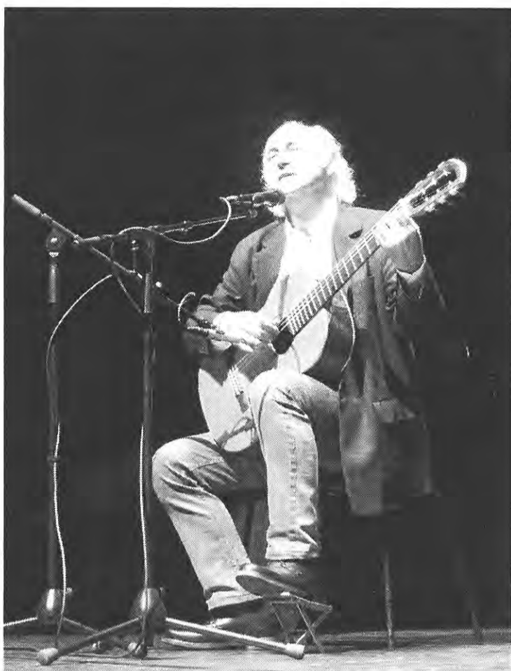
O cantautor bercliano Amancio Prada regresa a Ferrol

En canto á danza contemporánea, poderá verse "B-Flowers" (25 de abril), entre outros. Ao respecto da programación para