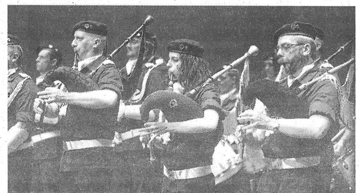
Un momento das actuacións no Auditorio

Ás 17.00 horas o polideportivo de Batallones acolle as actuacións da banda Nuestra Señora de la Misericordia, de Viveiro; Minerva y Veracruz de León; e a anfitriona, a ferrolá Virgen de la Amargura. ■