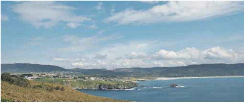
Covas atesora un importante patrimonio histórico, ambiental y, por supuesto, paisajístico. JOSÉ PARDO