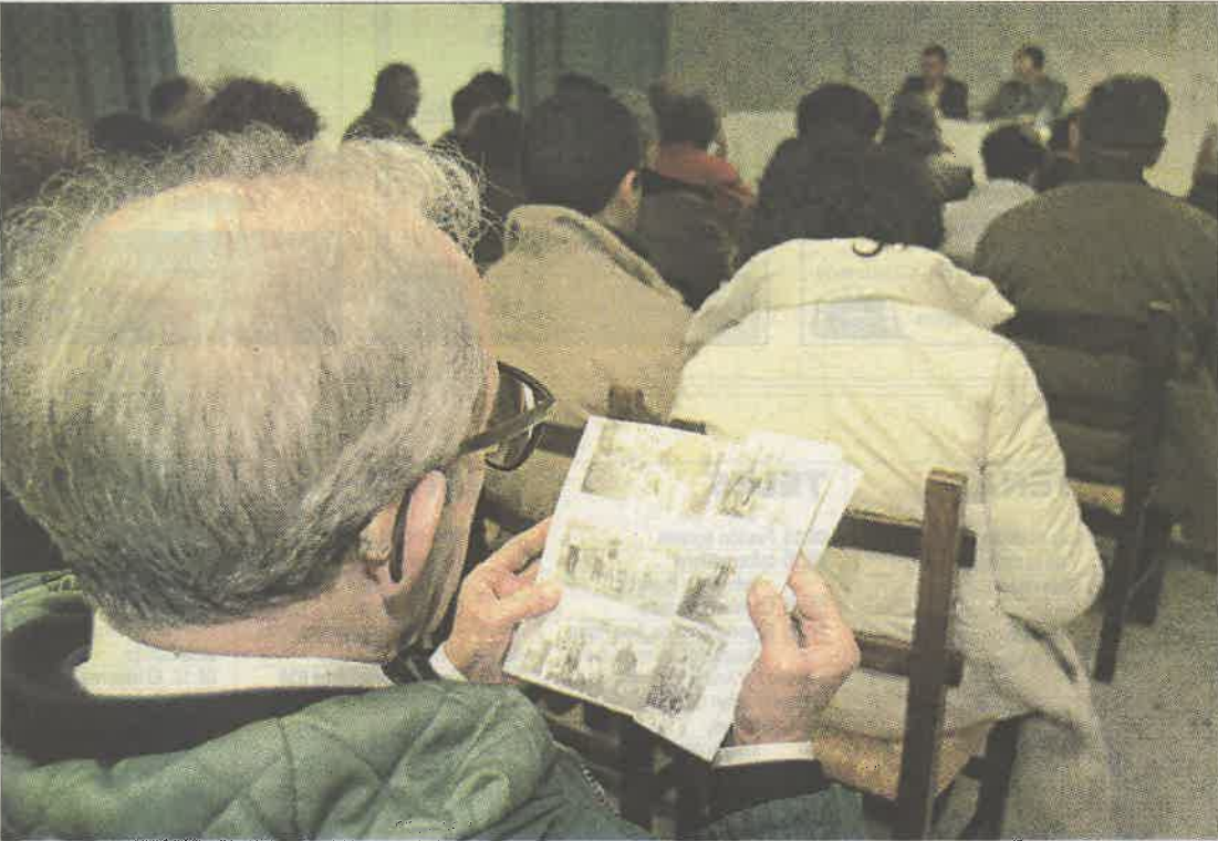
A presentación terá lugar esta tarde na Cooperativa, como en anos anteriores -imaxe de arquivo- ESTEVO BARROS

ESTUDOS LOCAIS > O número sete da revista da sociedade cultural de Covas sae á luz con novos artigos sobre a historia da parroquia