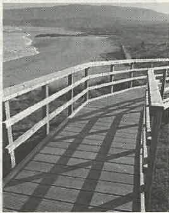
Imagen de Marmadeiro

2 Una de las actuaciones se ejecutó en el arenal de Marmadeiro, en las proximidades de Cabo Prior. En este caso, tal y como se pudo comprobar en la visita de ayer, la intervención consistió en la instalación de una pasarela de madera de acceso a la playa, con una longitud total de 140 metros. El Concello desembolsó 22.620,97 euros.