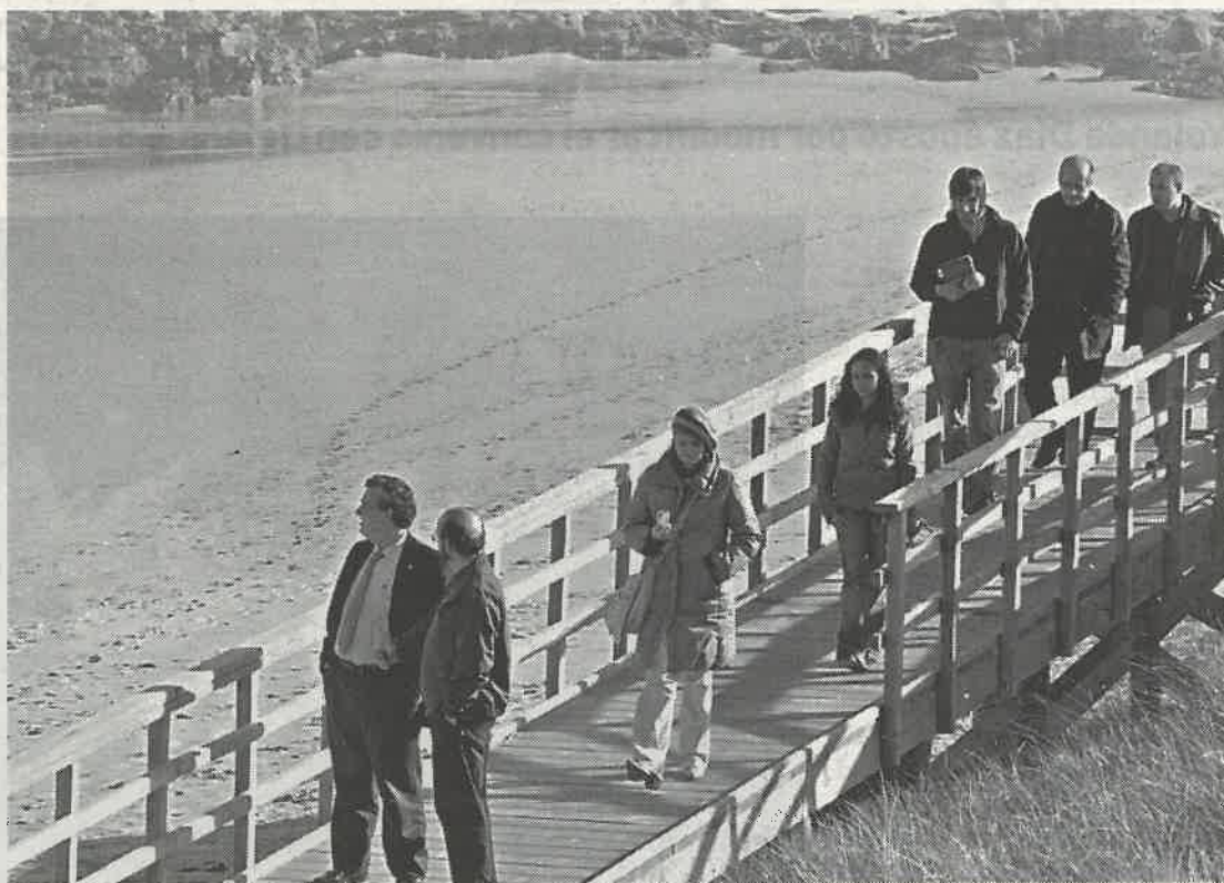
El alcalde y el concejal de Servicios comprobaron "in situ" los nuevos accesos a las playas

"Se ha dado un impulso importante en este campo para permitir