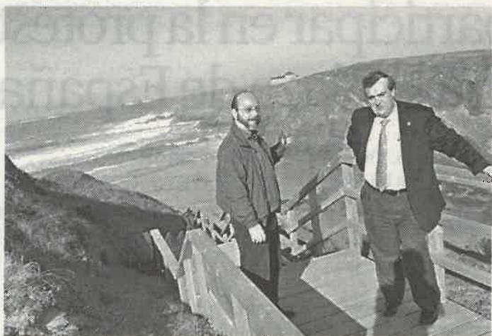
En As Fontes se instaló una escalera de acceso desde el parking