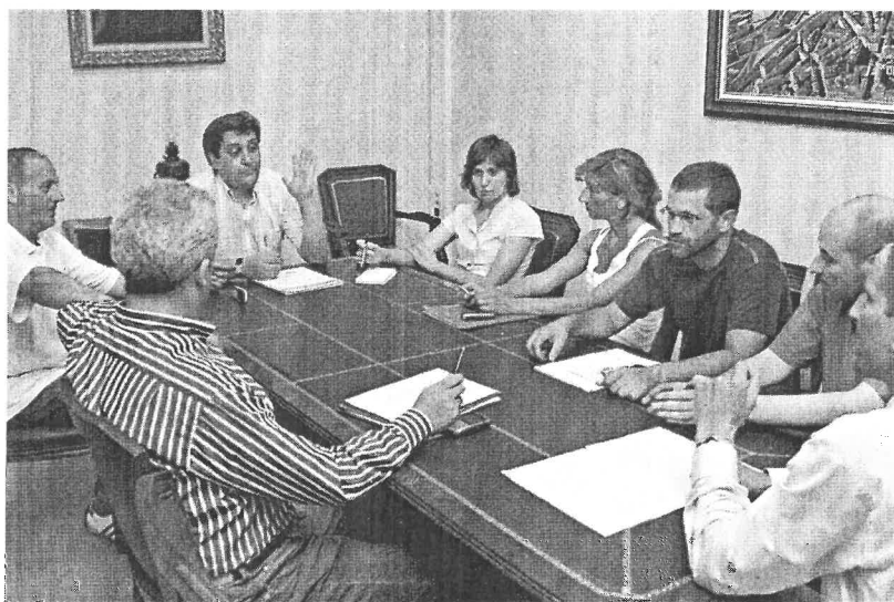
Un momento de la reunión celebrada ayer entre los miembros de la entidad