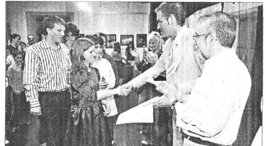
Un momento do acto celebrado onte no Ateneo