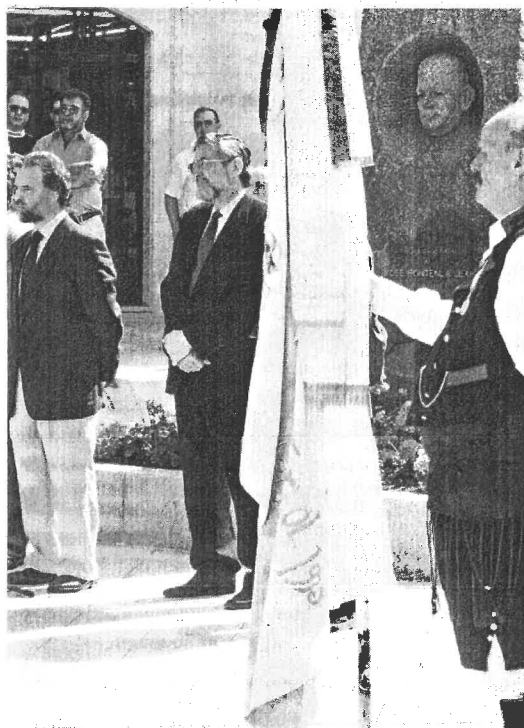
Imagen del acto celebrado en memoria de Fontenla en 1999

sus recursos económicos, llegó a poseer una de las mayores y mejores bibliotecas de toda la isla de Cuba, y al que difícilmente se le podrá dedicar nunca un Día das Letras, puesto que carece de obra publicada en gallego, pero que dedicó todo su esfuerzo a trabajar por la cultura, la lengua y la literatura de Galicia hasta el fin de sus días. Sus restos descansan en el cementerio de La Habana.