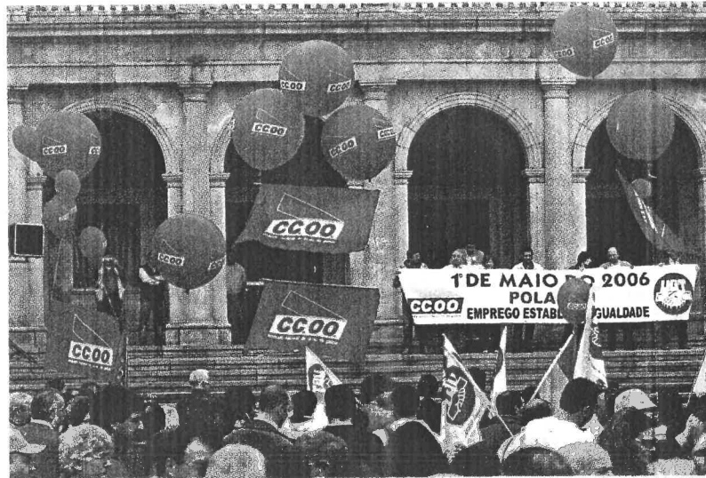
Un momento de la concentración de CCOO y UGT en la plaza de Armas

■ Las diferencias sindicales entre CCOO y UGT por un lado, y la CIG por otro, volvieron a definir ayer la celebración del Primero de Mayo. La jornada reunió a unas 2.000 personas -1.000 por cada convocante-, que demandaron empleo y estabilidad laboral y que, como en el caso de los sindicatos estatales, tuvo en el proceso de paz abierto tras la tregua permanente de ETA un referente obligado. El Plan Ferrol constituyó otro de los argumentos. > 02 Y 03