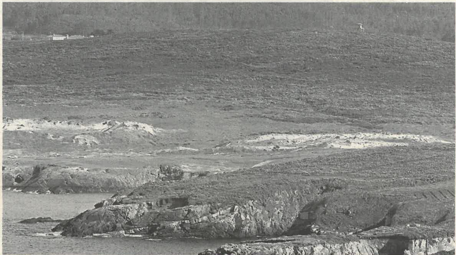
El campo de golf e instalaciones deportivas complementarias ocuparán una superficie superior a las 60 hectáreas

La decisión de la Comunidad de Montes de Covas fue adoptada en el transcurso de una asamblea extraordinaria celebrada el pasado domingo y, como destacó el edil de IF, fue respaldada por un amplio número de comuneros. De