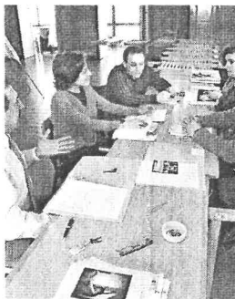
Primeira reunión do xurado L.P.

No premio Blanco Amor de novela longa participan máis de medio cento de concellos de Galicia. Está dotado con 12.000 euros e coa publicación da obra gañadora (este ano a través de Galaxia). O fallo coñecerase o sábado ás 13.30 horas no restaurante Casa