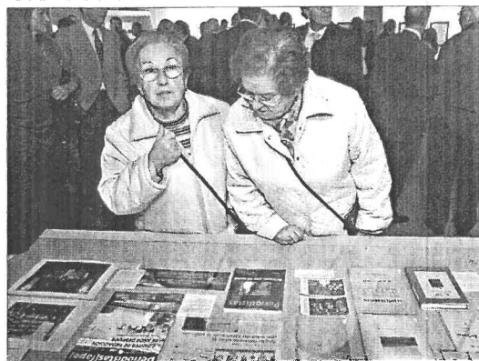
La Casa de Cultura Salvador de Madariaga acoge la muestra