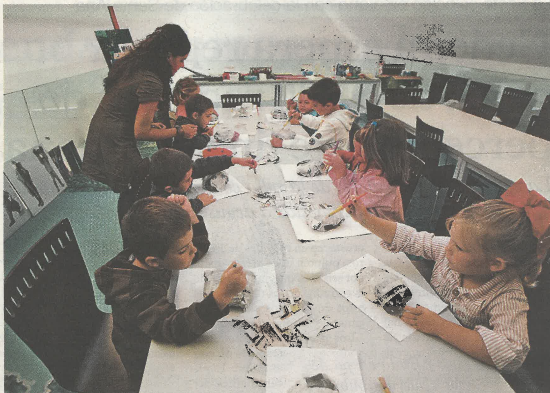
La Fundación Caixa Galicia acogió ayer un taller infantil con el que los niños practicaron el reciclaje

A través de la web. Aquellos que no quieran o puedan presenciar la muestra en el agua pueden hacerlo en la web www.sociedadecolumba.com .