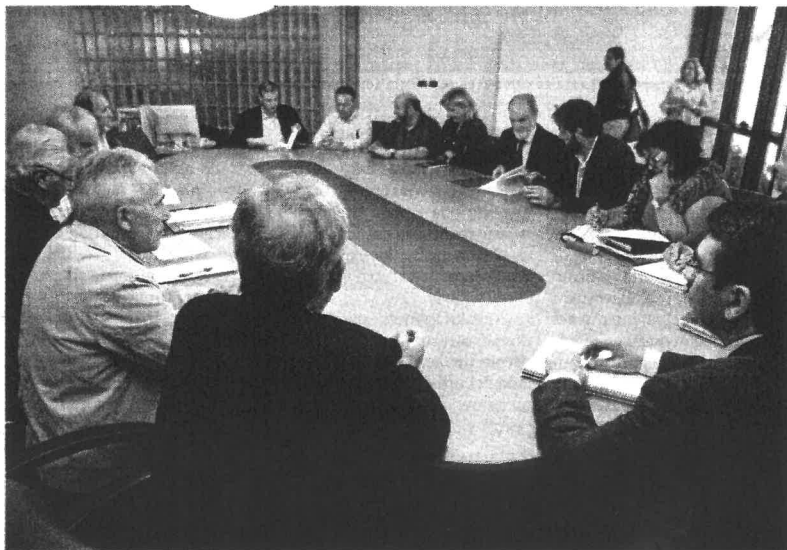
Un momento de la reunión de los alcaldes con el director xeral de Movidade

Iniciativa orientada a la promoción turística de la industria > 19