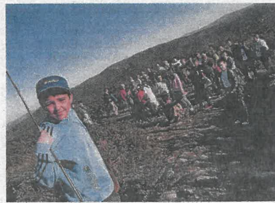
La Subida a Marraxón será el día 24

Subida a Marraxón. La parroquia fenesa de Santa Mariña de Silobre celebrará la semana próxima, como cada año, su tradicional Subida de