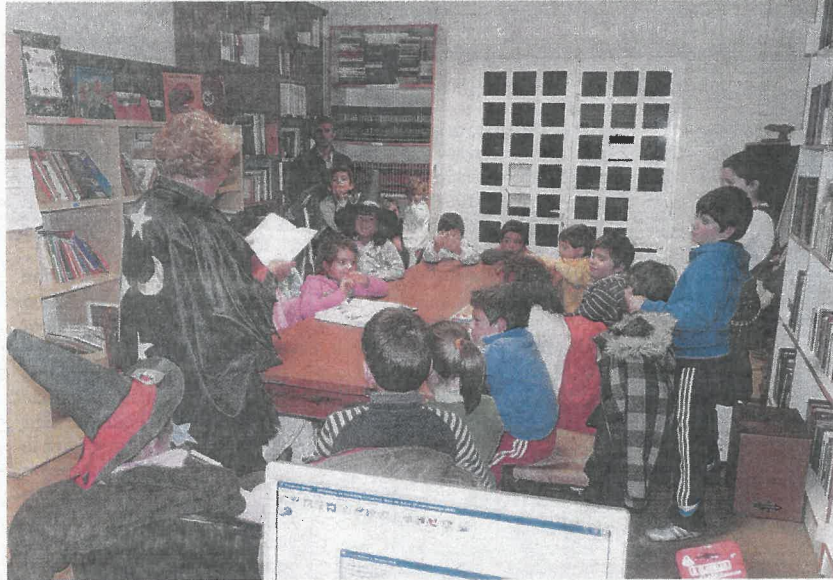
La Sociedad Cultural de Columba, de Covas, presta una especial atención al fomento de la lectura

Festival de la coral Alecrín. La coral Alecrín celebrará el sábado, en la iglesia de Santa María de Brión , su festival navideño, en el que compartirá escenario con la coral Areosa de Piñeiros y con las voces de Alentía , de Meirás .