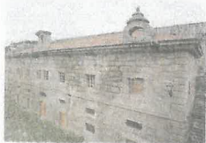
En la imagen, la Casa del Gobernador.