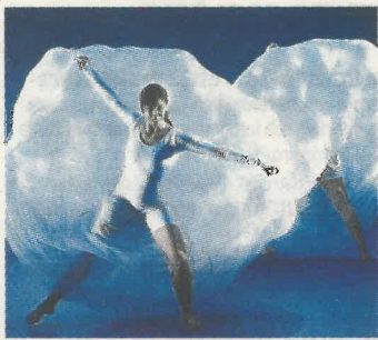
Unha imaxe da obra "Nubes"