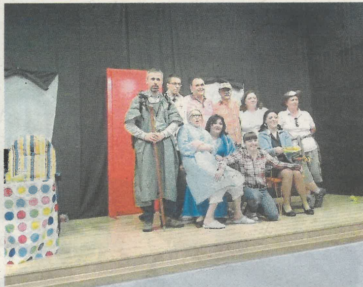
A compañía O Maxolo ao completo, que actuará mañá