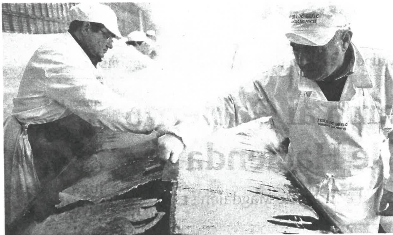
La «freixoira» industrial no paró en toda la mañana de preparar dulces para los comensales.