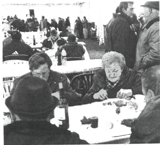
La feria repartió medio millar de raciones.